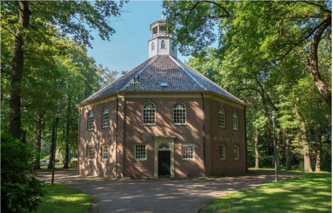
Boven: De Koepelkerk in Veenhuizen | Onder: De Catharinakerk in Roden