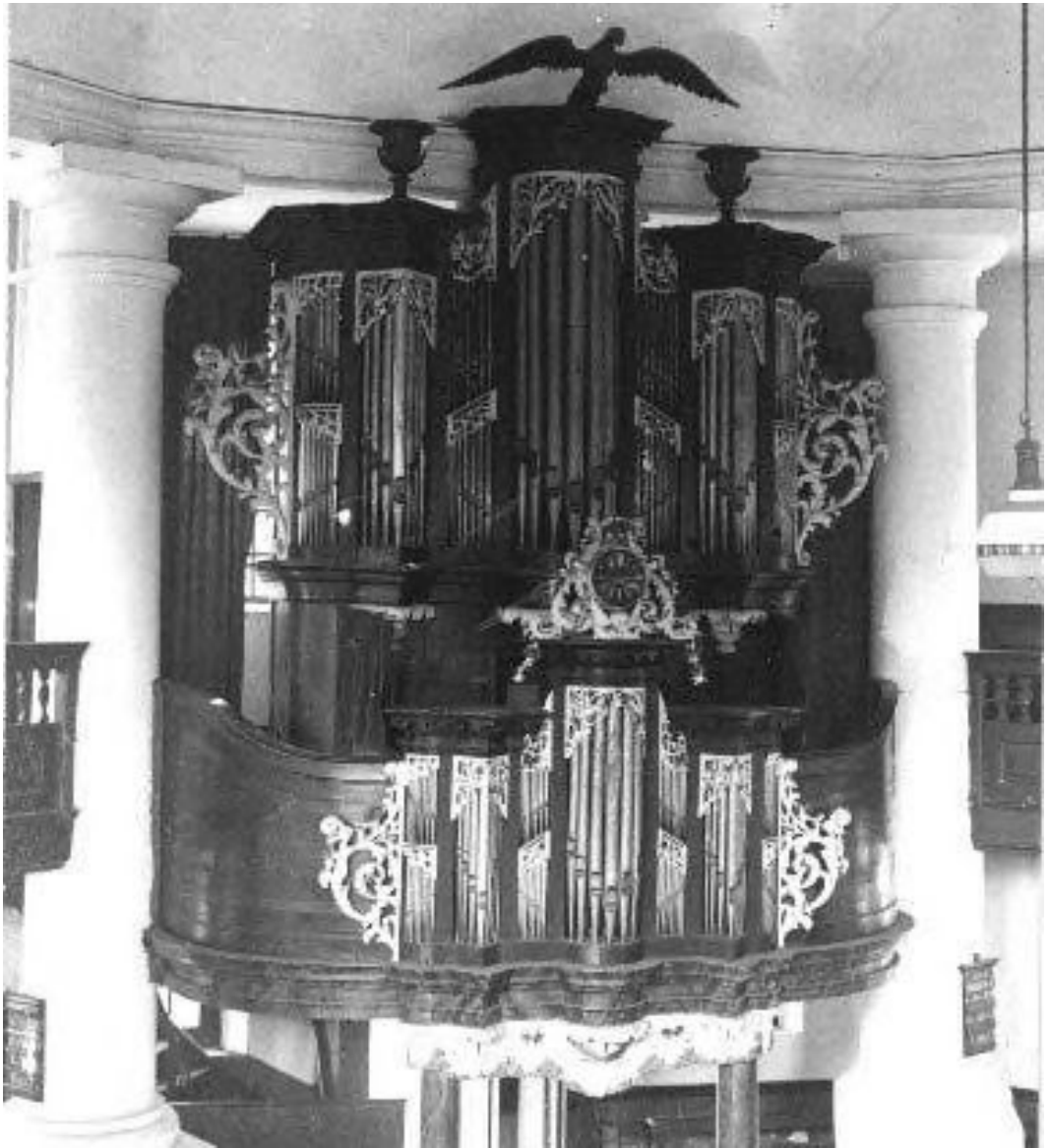
Het orgel voor 1963, foto: orgelsindrenthe.nl